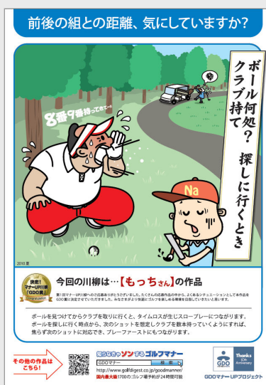
【ポスターのイメージ画像】