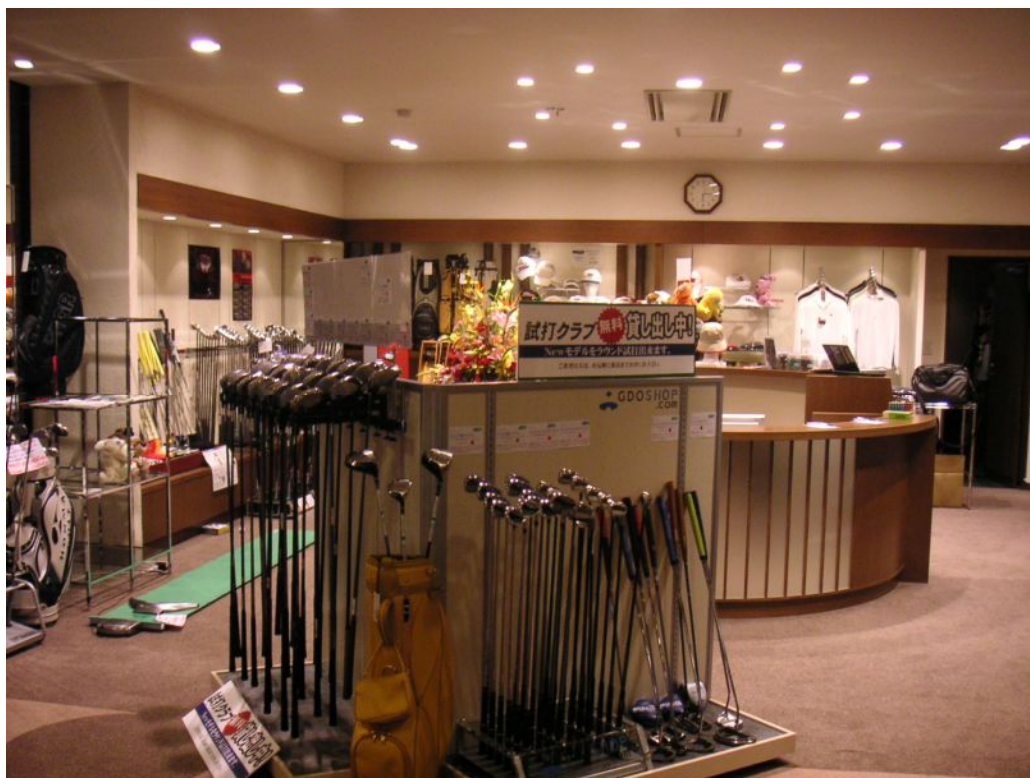
■リニューアルオープンした『央戸ヒルズカントリークラブ』のプロショップ（10月10日撮影）