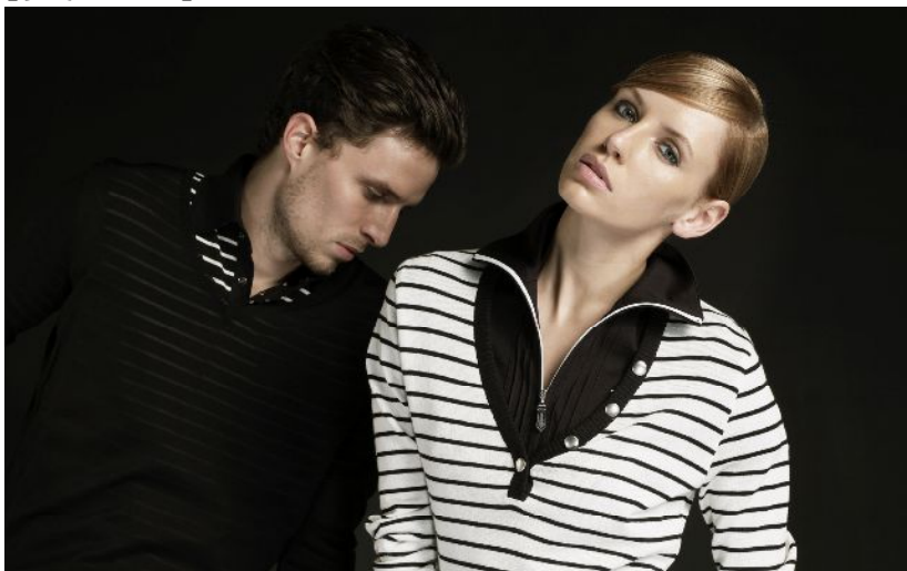
高解像度の写真データをお求めの方は (株)サンエー・インターナショナル キャロウェイゴルフアパレル 北川までお問い合わせをお願い致します。