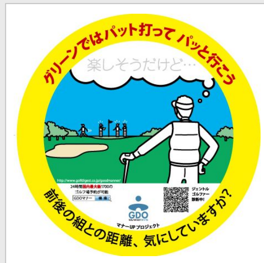
【ステッカー イメージ画像】

GDO は、今後ともゴルファーのマナーアップ向上施策を推進し、ゴルフ市場の活性化を推進してまいります。