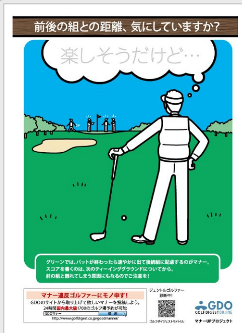
【ポスター イメージ画像】

近年のゴルフブーム、及びプレースタイルの多様化に伴い、プレー中や観戦中のマナー違反が問題視されています。GDOでは、ゴルフに関わる全ての人々が、快適にゴルフができる環境の実現を目指し、本プロジェクト活動を通じて、全国のゴルファーに対しマナーレベルの向上を呼びかけてまいります。