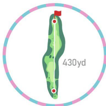
現在地がわかるから 知りたい距離をかんとたん測定