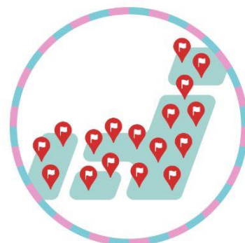
全国2,400コース以上を網羅！ コースデータの取り込みも簡単