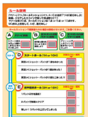
ミッションカード(イメージ)

GDOは本企画で、単にスコアやプレーだけでなく、運だめしというゲーム性を強めた、新感覚のゴルフの楽しみ方を提供いたします。