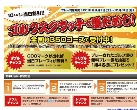
サイトトップ画面