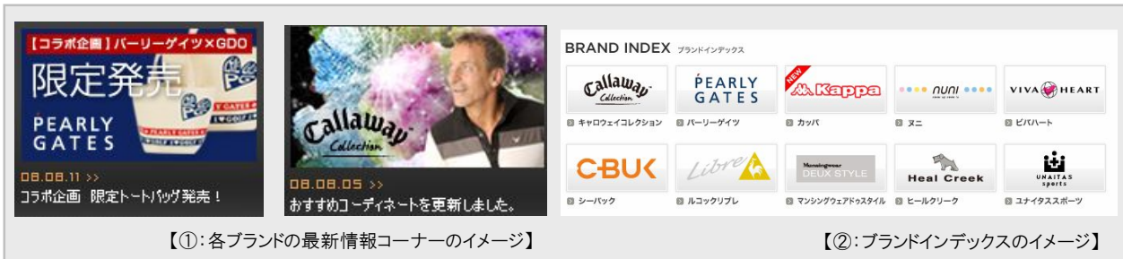
【①：各ブランドの最新情報コーナーのイメージ】